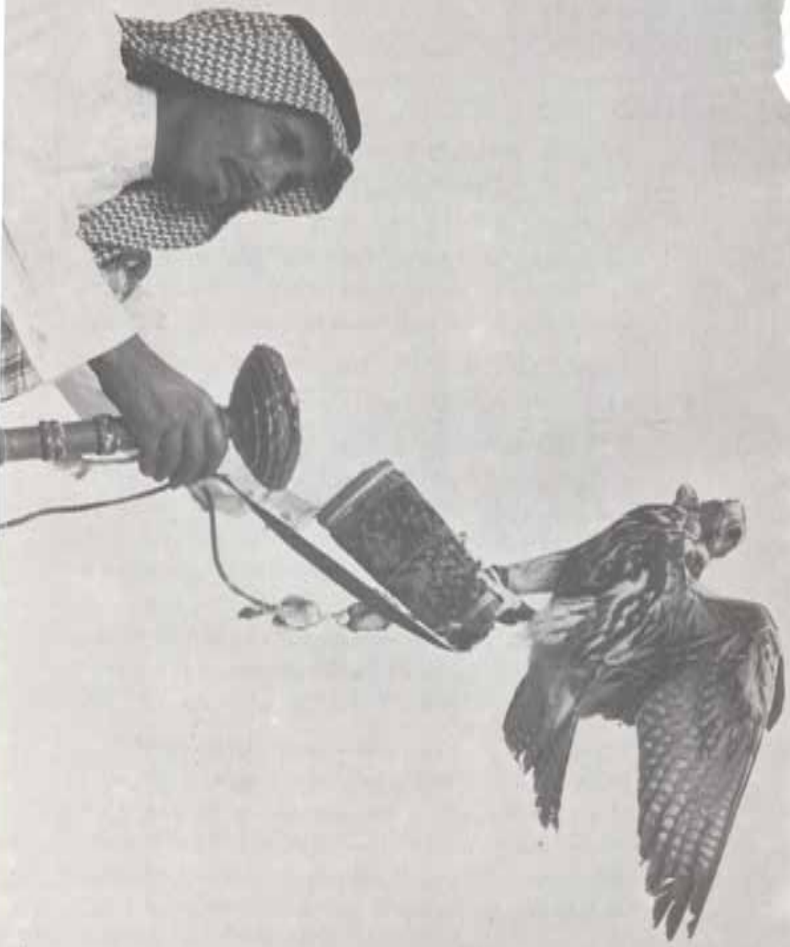
الصيد : إحدى رياضات السيد القطري في الطير

Falconry : One of Qatar's traditional sports