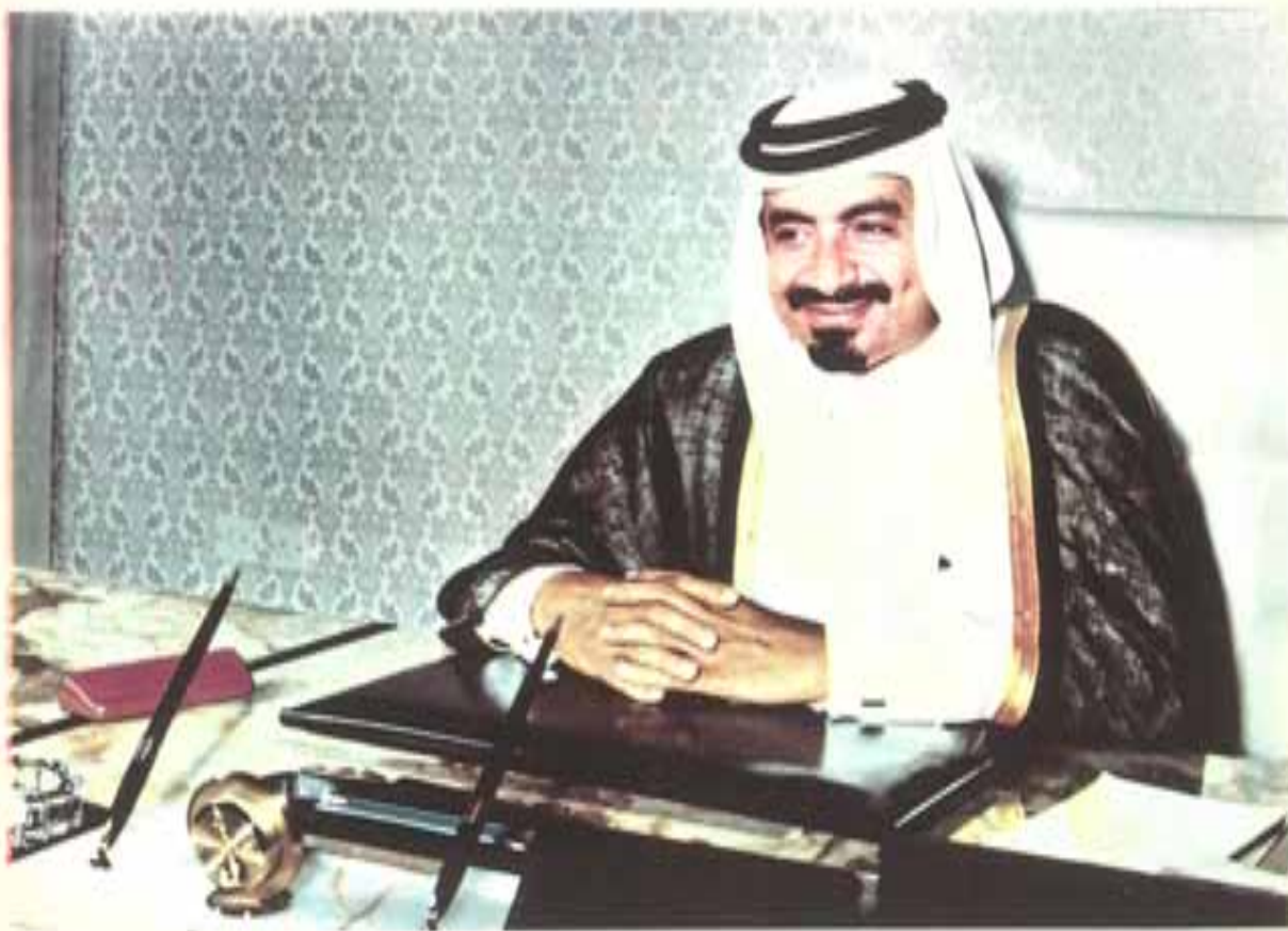
صاحب السمو الشيخ خليفة بن زايد آل نهيان أمير دولة قطر